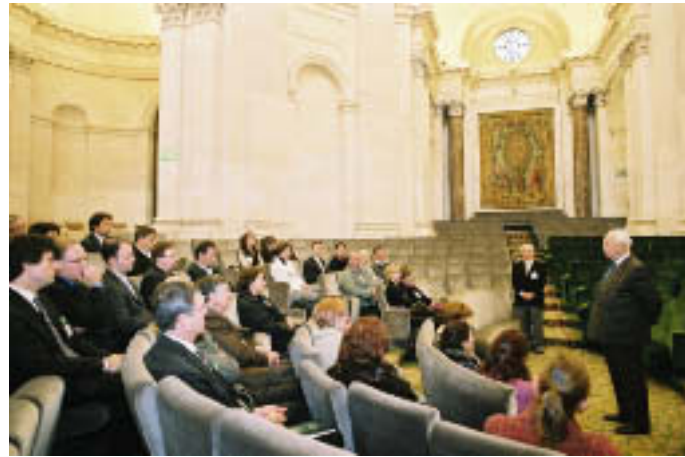
Les chercheurs sont accueillis sous la Coupole de l'Institut de France par M. Pierre Messmer, chancelier de l'Institut, président de la Fondation.

Le but de cette réunion était de présenter l'état d'avancement des 19 études en cours depuis quatre ans sur les causes et les mécanismes d'évolution de la scoliose idiopathique, de les discuter et d'étudier les possibilités de mise en commun de certains moyens d'investigation.